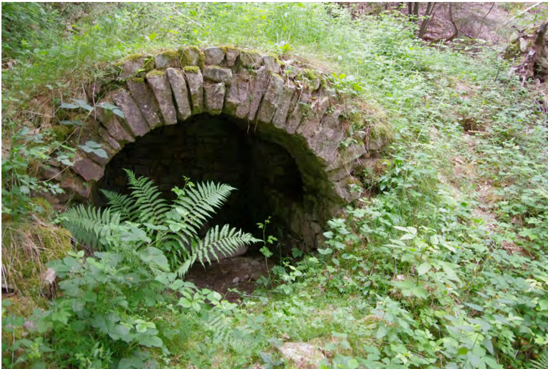
La cave du tailleur de pierres sur la montagne des Eguillettes