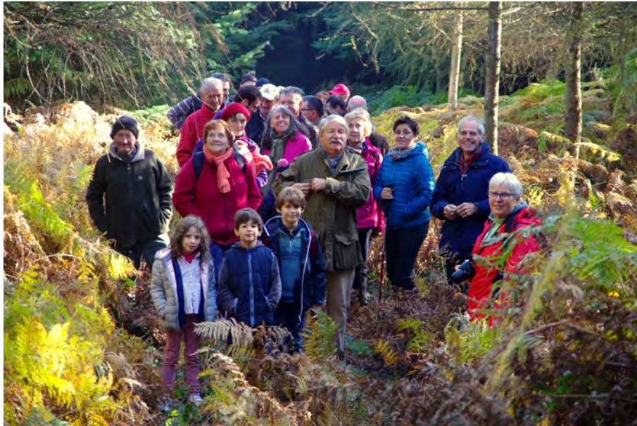
Sortie à la pépinière en 2018